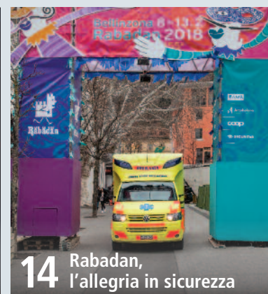
14 Rabadan, l'allegria in sicurezza