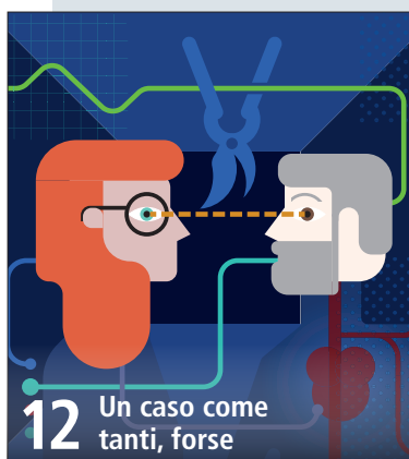
12 Un caso come tanti, forse