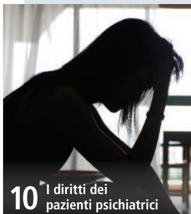
10 I diritti dei pazienti psichiatrici