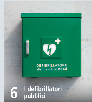
6 I defibrillatori pubblici