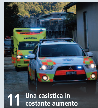
11 Una casistica in costante aumento